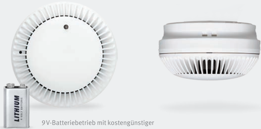
9V-Batteriebetrieb mit kostengünstiger Alkaline oder langlebiger Lithium-Powercell.

Als Basiskomponente für Rauchmeldesysteme im privaten und gewerblichen Bereich.